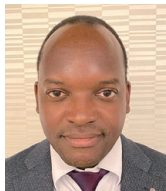
センクンバジャコブ 宇部西RC 2024年10月29日 塾経営